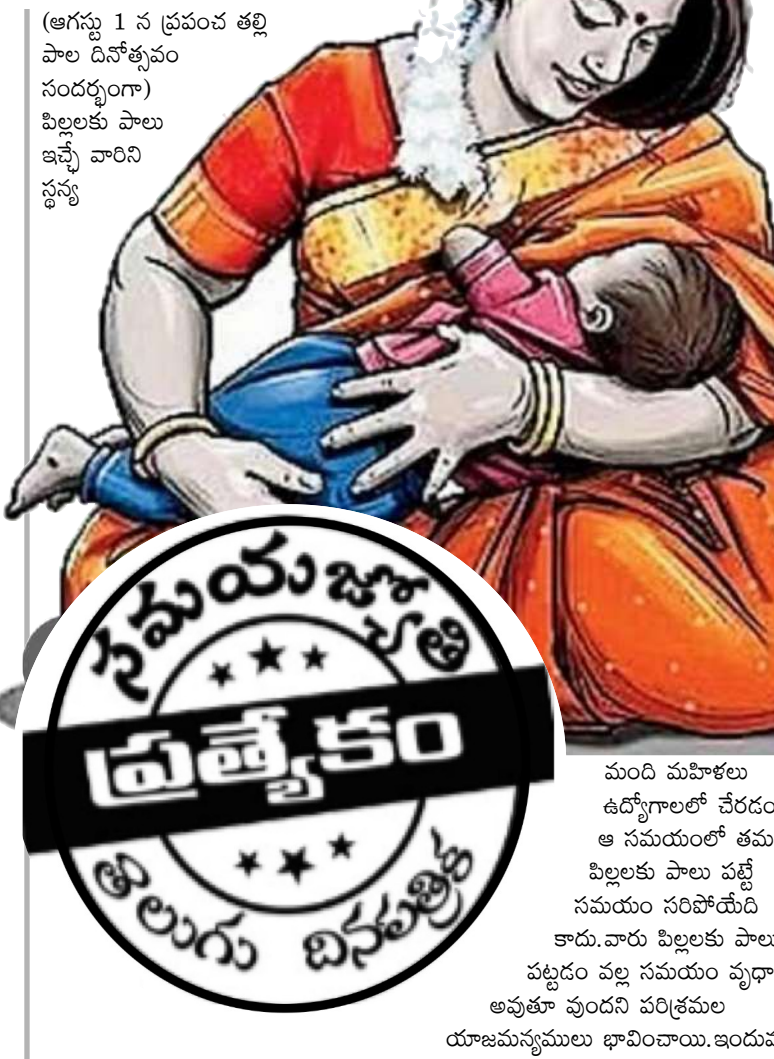
మంది మహిళలు ఉద్యోగాలలో చేరడం, ఆ సమయంలో తమ పిల్లలకు పాలు పట్టే సమయం సరిపోయేది కాదు. వారు పిల్లలకు పాలు పట్టడం వల్ల సమయం వృధా అవుతూ వుందని పరిశ్రమల యాజమాన్యములు భావించాయి. ఇందువల్ల