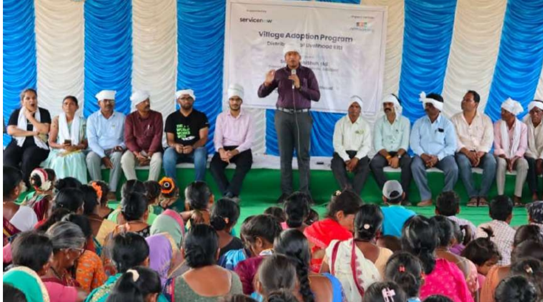
ద్వార నాణ్యమైన విద్యను విద్యార్థులకు అందిస్తున్నారని, విద్యార్థులు మంచిగా చదువు కొని భావిక రాలకు ఆదర్శంగా నిలవాలని, గ్రామాల నుండి